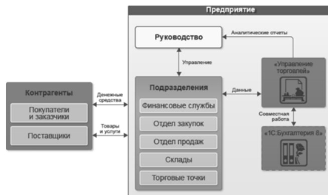
Рисунок 1. – Предметная область, автоматизируемая с помощью «1 С: Управление торговлей 8»

Задача 3. Поясните по рисунку 1 охваченные на предприятии автоматизацией бизнес-процессы. Как они реализованы с помощью ПО 1С. Предприятие?